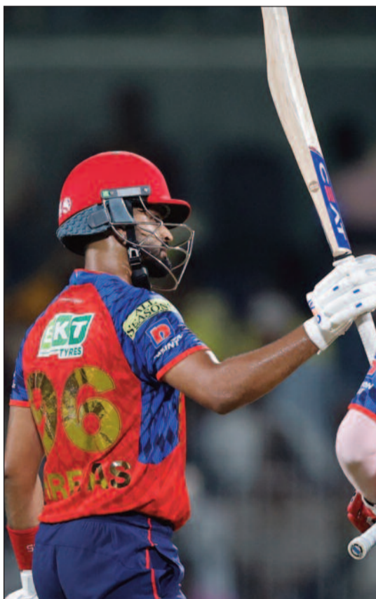
ఓవర్లో హ్యాట్రిక్ ఫోర్లతో ఇన్నింగ్స్ కు ఊపు తెచ్చాడు. సర్పరాజ్ నిద్రమించినా అప్పటికే క్రీజాలో కుదురుకున్న దూబె.. ఖాన్ షాట్లతో చెన్నైకి ఫినిషింగ్ టచ్ ఇచ్చాడు.

చెన్నై: 20 ఓవర్లకు 209/5 (మాత్ర 73, దూబె 45లి, వైశాక్ 2/38, చాహాల్ 1/21); పంజాబ్: 18.4 ఓవర్లలో 210/5(అయ్యర్ 50, ప్రభాసిప్రన్ 43, కంబోజ్ 2/43, హెన్రీ 2/54)