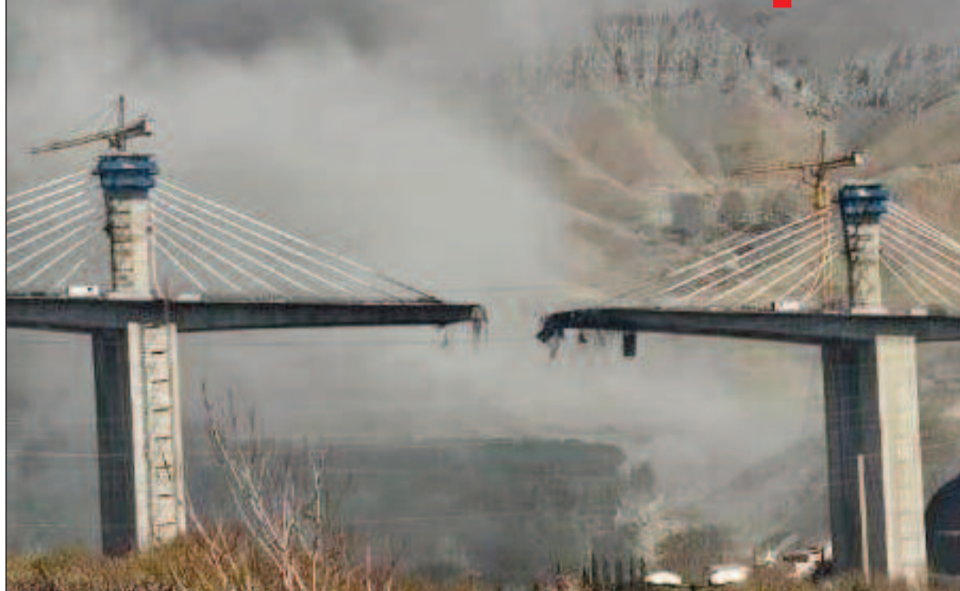
వంతెనలను కూల్చేస్తామని హెచ్చరించింది. ట్రంప్ బెదిరింపు ప్రకటనలు, మౌలిక సదుపాయాలపైనా అమెరికా, ఇజ్రాయల్ దాడుల నేపథ్యంలో.. ఇరాన్ కూడా భారీ స్థాయిలో దాడులకు దిగింది. ఇజ్రాయల్ తోపాటు గల్ఫ్ దేశాలపై క్షిపణులు, డ్రోన్లతో విరుచుకుపడింది. కువైట్ లోని చమురు రిఫైనరీపై ఇరాన్ డ్రోన్ దాడులతో భారీగా మంటలు చెలరేగాయి. దానితోపాటు ఇరాన్ క్షిపణి దాడుల్లో ఒక విద్యుదుత్పత్తి కేంద్రం, సముద్రపు నీటిని మంచినీటిగా మార్చే డీసాలినేషన్ కేంద్రం దెబ్బతిన్నట్లు కువైట్ ప్రకటించింది. యూఏఈలో అతిపెద్దదైన 'హబ్బాన్ గ్యాస్ రిఫైనరీ'పై క్షిపణుల శకలాలు పడి, పేలుళ్లు జరిగాయి.. భారీగా మంటలు చెలరేగడంతో తాత్కాలికంగా ఉత్పత్తిని నిలిపివేశామని అబుధాబి మీడియా కేంద్రం ప్రకటించింది. యూఏఈలోని అబుధాబిలో క్షిపణుల శకలాలు పడి బదుగురు భారతీయులు సహా 12 మంది గాయపడ్డారు. ఒక సేవారి వ్యక్తి మృతిచెందారు. దుబాయ్ లోని ఒరాకిల్, బహ్రాయిన్ లోని అమెజాన్ బిల్డింగ్ సంస్థల డేటా సెంటర్లపై దాడులు చేశామని ఇరాన్ రెవెన్యూషనరీ గార్డ్స్ శుక్రవారం ప్రకటించింది. పశ్చిమాసియాలోని తమ శత్రుదేశాల బెక్ సంస్థలపై లక్ష్యంగా చేసుకుంటామని పేర్కొంది. అయితే ఒరాకిల్ డేటా సెంటర్లపై దాడి ఏమీ జరగలేదని, అది తప్పదు వార్త అని దుబాయ్ పేర్కొంది. బహ్రాయిన్ లోని తమ డేటా సెంటర్లపై దాడులు జరిగినట్లు అమెజాన్ వెబ్ సర్వీస్ ప్రతినిధులు వెల్లడించారు. ఇరాన్ లోని బుషెహర్ ప్రావిన్స్ లో ప్రజలకు మానవతా యాం కింద సరుకులను తరలిస్తున్న రెండు కంటెయినర్లు, రెండు బస్సులు, పలు అత్యవసర వాహనాలు శుక్రవారం యూఎస్, ఇజ్రాయల్ దాడిలో ధ్వంసమైపట్టు రెడ్ క్రాస్/రెడ్ క్రీస్టంట్ సంస్థల ఫెడరేషన్ ప్రకటించింది. ఇజ్రాయల్ లోని జఫా ప్రాంతంపై పదుల సంఖ్యలో బాలిస్టిక్ క్షిపణులతో దాడి చేసినట్లు యెమెన్ లోని హాతీ మిలిటరీ ప్రతినిధి యహ్యీ సరీ వెల్లడించారు.

ఇరాన్ లోని ఎత్తయిన వంతెనను పేల్చేసిన అమెరికా 8 మంది మృతి.. 95 మందికి గాయాలు ప్రతీకారంగా పశ్చిమాసియాలోని 8 భారీ వంతెనలను కూల్చేస్తామని ఇరాన్ ప్రకటన కువైట్ చమురు లిఫ్టినర్లపై దాడి.. అబుధాబిలో క్షిపణి శకలాలు పడి బదుగురు భారతీయులకు గాయాలు మరో ఎఫ్-35ను కూల్చేస్తామన్న ఐఆర్జిసీ గాలింపు చేపట్టిన అమెరికా హెలికాప్టర్ ను కూడా..! పైలట్లను ప్రాణాలతో పట్టిస్తే భారీ బహుమతి అంటూ ఇరాన్ స్థానిక అధికారుల ప్రకటన ఇరాన్ సైన్యం ఆధీనంలో ఒక పైలట్? బ్రిడ్జి పేల్చేవేత అమెరికా సైనిక పతనానికి సాక్ష్యం దౌత్యానికి తలుపులు పూర్తిగా మూసుకున్నాయి ఇక చర్చలు ఉండవు: ఇరాన్ విదేశాంగ మంత్రి ఇరాన్ లో వంతెనలు, విద్యుత్ కేంద్రాలు ధ్వంసం చేస్తాం హోర్నుజ్ ను తెలిచి, చమురు స్వాధీనం చేసుకోగలం ఆలస్యం కాకముందే ఒప్పందానికి రావాలి: ట్రంప్