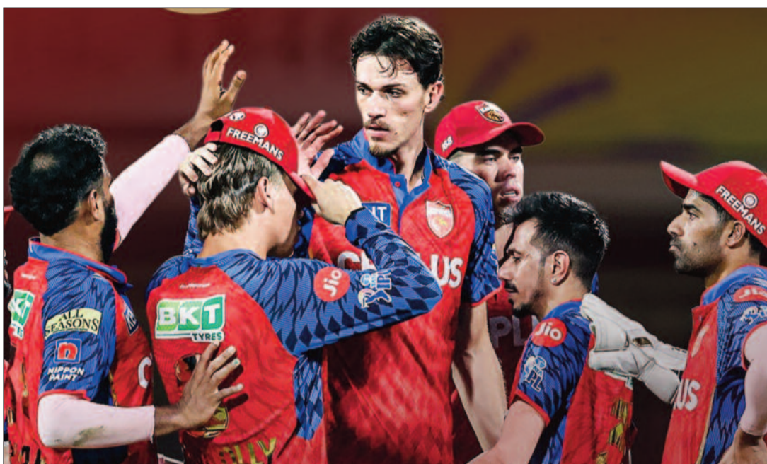
పంజాబ్ ఆడుతూ పాడుతూ..

చెన్నై : ఐపీఎల్ లో నిరుదారితో పంజాబ్ కింగ్స్ వంశం విజయాల జోరు కొనసాగుతున్నది. శుక్రవారం విదంబరం స్టేడియంలో జరిగిన పోరులో పంజాబ్ 5 వికెట్ల తేడాతో చెన్నై సూపర్ కింగ్స్ పై ఘన విజయం సాధించింది. చెన్నైని వారి సొంత ఇలాఖాలో మట్టికరిపించిన పంజాబ్ వరుసగా రెండో విజయాన్ని ఖాతాలో వేసుకుంది. చెన్నై నిర్దేశించిన 210 పరుగుల లక్ష్యాన్ని పంజాబ్ 18.4 ఓవర్లలో 5 వికెట్లు కోల్పోయి విజయాన్ని దులుబులు చేసింది. కెప్టెన్ శ్రేయాస్ అయ్యర్ (29 బంతుల్లో 50, 4 ఫోర్లు, 3 సిక్స్లు) అర్ధసెంచరీకి తోడు ప్రభాసిప్రన్ సింగ్ (43), ప్రియాంశ్ ఆర్య (39), కనోలి (36) రాణించడంతో పంజాబ్ గెలుపు సులువైంది. హెన్రీ, కంబోజ్ రెండో వికెట్లు తీశారు. తొలుత కింగ్స్ ఆహ్వానం మేరకు ఫస్ట్ బ్యాటింగ్ చేసిన చెన్నై.. ఆయుష్ మాత్ర (43 బంతుల్లో 73, 6 ఫోర్లు, 5 సిక్స్లు) వీరవిహారానికి తోడు శివమ్ దూబె (27 బంతుల్లో 45 నాటౌట్, 5 ఫోర్లు, 1 సిక్స్), సర్పరాజ్ ఖాన్ (12 బంతుల్లో 32, 6 ఫోర్లు, 1 సిక్స్) దూకుడుగా ఆడటంతో 20 ఓవర్లకు 5 వికెట్లు కోల్పోయి 209 పరుగులు చేసింది. విజయోత్సవం(2/38) రాణించారు.