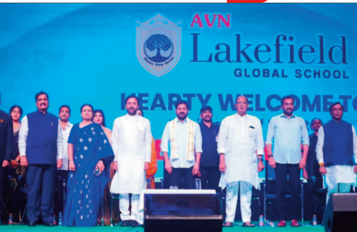
విద్యావ్యవస్థలోని లోపాలు అత్యంత ప్రమాదకరమని, వీటిని సరిచేయాల్సిన అవసరం ఉందని అన్నారు.

ఓకో విద్యార్థికి రూ.1.08 లక్షలు ఖర్చు.. ప్రభుత్వ విద్యాసంస్థల్లో సంస్కరణలు తీసుకురావాలని అవసరం ఉందని, దీనిపై ప్రజా ప్రతినిధులంతా ఆలోచించాలని సీఎం రేవంత్ అన్నారు. ప్రతి ఏటా ప్రభుత్వం విద్య కోసం భారీగా నిధులు ఖర్చు చేస్తున్నా.. ఆ మేర ఫలితాలు రావడం లేదని ఆవేదన వ్యక్తం చేశారు. “ప్రతి ఏటా రాష్ట్రంలో 1.10 లక్షల మంది విద్యార్థులు ఇంజనీరింగ్లో ఉత్తీర్ణులవుతున్నారు. కానీ, వీరిలో ఎంత మందికి ఉద్యోగం కావాలి? వారు చదువుకున్న సర్టిఫికేట్ కు, ఉద్యోగానికి సంబంధం ఉంటుందా? అనేది చూస్తే ఆందోళన కలుగుతోంది. నాణ్యమైన విద్య అందించకపోవడమే దీనికి కారణం” అని సీఎం అన్నారు. ప్రభుత్వ స్కూళ్లలో చదివే ఓకో విద్యార్థి కోసం ప్రభుత్వం ఏటా రూ.1.08 లక్షలు ఖర్చు చేస్తోందని తెలిపారు. ఇటీవల ఒక సర్వేలో ఆరో తరగతి చదివే విద్యార్థులు మూడో తరగతి పుస్తకాలు కూడా చదవలేకపోతున్నట్లు తెలిందన్నారు. 9 మంది పిల్లలు ఉన్నచోట బదులుగా టీచర్లు పనిచేస్తున్నారని, రాష్ట్ర ప్రభుత్వం ఆధ్వర్యంలో 26 వేల స్కూళ్లలో 18 లక్షల మంది విద్యార్థులు చదువుతున్నారని వెల్లడించారు. ఇదే సమయంలో రాష్ట్రంలోని 11 వేల ప్రైవేటు స్కూళ్లలో 33 లక్షల మంది చదువుతున్నారని చెప్పారు. “ప్రభుత్వ విద్యావిధానంలో, ప్రైవేటు విద్యావిధానంలో ఎందుకు మార్పు ఉంది? పేదల కూడా తమ పిల్లలను ప్రైవేటు స్కూళ్లలోనే చదివించుకోవాలని ఎందుకు అనుకుంటున్నార?” అని ప్రశ్నించారు. ప్రభుత్వ